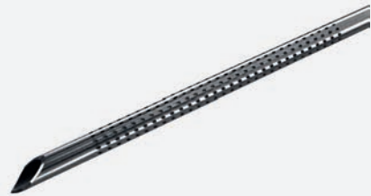
Игла 21 Gage, длина 4 см, с эхоконтрастной насечкой